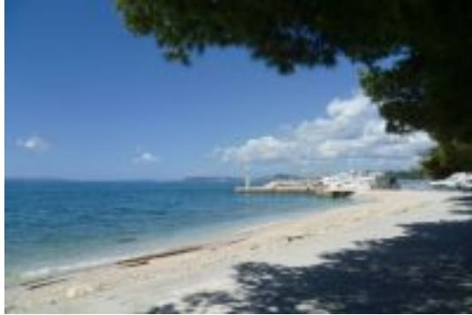
Reiseziel Weltkulturerbe in Split, Kroatien