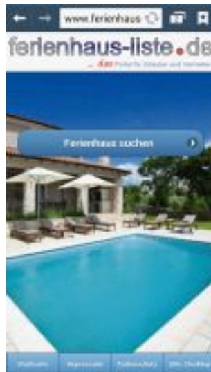
Ferienhaus-Portal für mobile Seiten und Tablets